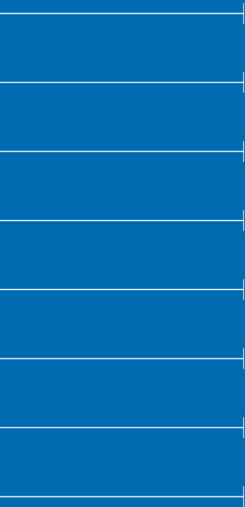
Illustration: Susanne Fredelius