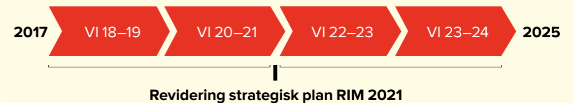
Figur 1: Den strategiska planen delas upp i två perioder, 2018–2021 och 2022–2025. Mellan 2018 och 2025 rymmer fyra verksamhetsinriktningar som RF- och SISU-stämman beslutar om.