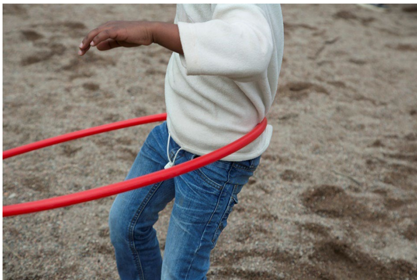
Bildtext: bild på ett barn som använder en rockring

Mot slutet av vårterminen 2023 initierades samverkan med både Gävle Fäktförening och Gävle Taekwondo som bjöd in att delta i DOIT:s verksamhet för att visa upp sina verksamheter.