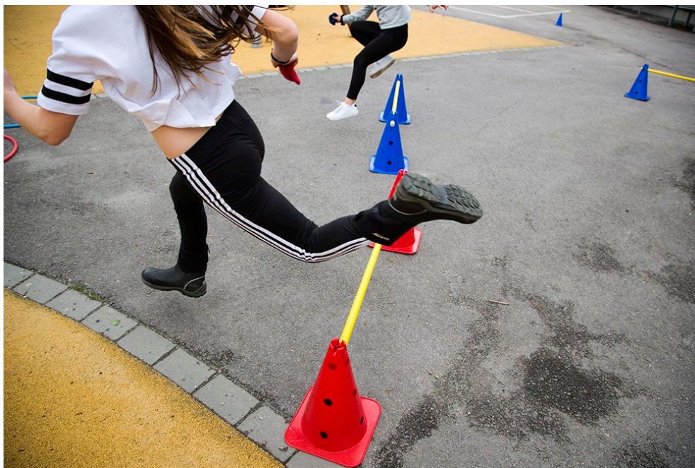
Bildtext: bild på ett barn som hoppar över ett hinder ute på en skolgård. Ett ytterligare barn syns i bakgrunden.

Den 18 april 2023 genomfördes en nätverksträff för samtliga skolor i Gävle på DOMÉ Adrenalin Zone där pedagoger från skolans rörelseteam medverkade. Syftet med dagen var att bygga en bro mellan skola och förening för att i framtiden kunna samverka vidare i skolmiljö samtidigt som pedagogerna fick inspiration och kunskap för att själva kunna arrangera nya aktiviteter för barnen på sina respektive skolor. Pedagogerna fick under dagen prova på fäktning (Gävle Fäktförening), cheerleading (Gävle Gymnastikförening), skateboard (Gävle Skateboardsällskap) och klättring (Gestrike Klätterklubb) samt introduktion i resp. idrotts specifikt framtagna material för skolmiljö.