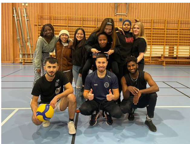
En av föreningarna vi arbetat med i Ljusdals kommun är Ni Vi Sport För Dig. Under 2022 har föreningen hittat flera nya ledare och utvecklat verksamheten, bland annat med fotbollsfredagar och aktiviteter för tjejer.

En uppenbar effekt av pandemiåren är att distriktets föreningar befinner sig i behov av stöd på många olika områden. Under 2022 har RF-SISU Gävleborg främst prioriterat stödinsatser till föreningar som behövt hjälp med en "återstart", där behålla, rekrytera och stärka engagemang och ekonomi har varit primära insatser för att hitta hållbara vägar framåt. Utmaningarna är nationellt särskilt stora när det gäller pojkar i de lägre åldrarna, flickor i tonåren samt personer med funktionsnedsättning, där tappet efter pandemin är mycket stort. Tendensen ser något annorlunda ut i Ljusdals kommun, där tappet främst skett bland äldre tonåringar, både flickor och pojkar. Här följer några nedslag från vår verksamhet i kommunen 2022.