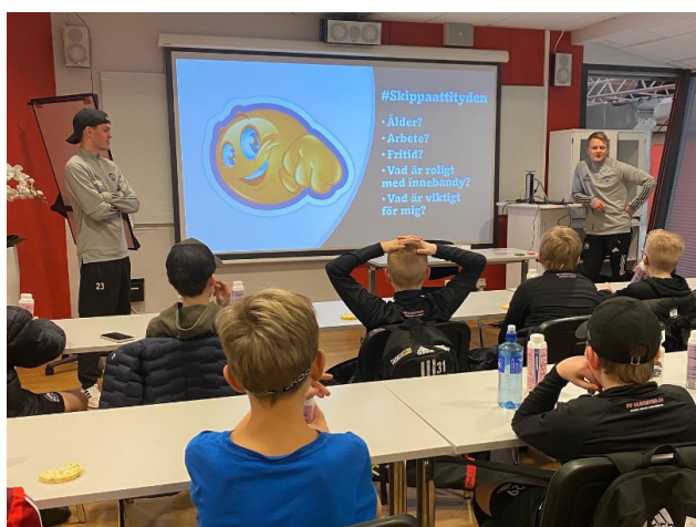
TVå av våra utbildade "Skippa-attityden-ambassadörer" har samlat unga aktiva i SAIK innebandy för en dialogträff på temat "värdegrund i din träningsgrupp".

En uppenbar effekt av pandemiåren är att distriktets föreningar befinner sig i behov av stöd på många olika områden. Under 2022 har RF-SISU Gävleborg främst prioriterat stödinsatser till föreningar som behövt hjälp med en "återstart", där behålla, rekrytera och stärka engagemang och ekonomi har varit primära insatser för att hitta hållbara vägar framåt. Utmaningarna är nationellt särskilt stora när det gäller pojkar i de lägre åldrarna, flickor i tonåren samt personer med funktionsnedsättning, där tappet efter pandemin är mycket stort. Tendensen märks även i Sandvikens kommun, med undantaget att tappet bland flickor i tonåren är något mindre. Här följer några nedslag från vår verksamhet i kommunen 2022.