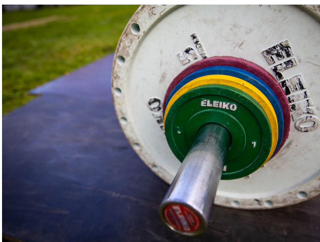
Tyngdlyftning med Bergsjö Atletklubb stod på prova-på-programmet när Folkhälsodagarna genomfördes i Nordanstigs kommun 2022. RF-SISU Gävleborg fanns med som föreningsstöd på temat återstart och rekrytering.

En uppenbar effekt av pandemiåren är att distriktets föreningar befinner sig i behov av stöd på många olika områden. Under 2022 har RF-SISU Gävleborg främst prioriterat stödinsatser till föreningar som behövt hjälp med en "återstart", där behålla, rekrytera och stärka engagemang och ekonomi har varit primära insatser för att hitta hållbara vägar framåt. Utmaningarna är nationellt särskilt stora när det gäller pojkar i de lägre åldrarna, flickor i tonåren samt personer med funktionsnedsättning, där tappet efter pandemin är mycket stort. Tendensen märks även i Nordanstigs kommun, med tillägget att tappet även märks bland pojkar i tonåren. Här följer några nedslag från vår verksamhet i kommunen 2022.