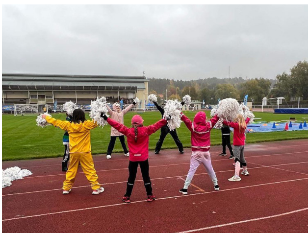
Hög grad av rörelseglädje på Idrottens dag i Hudiksvall, trots att vädret inte visade sig från sin bästa sida ...

En uppenbar effekt av pandemiåren är att distriktets föreningar befinner sig i behov av stöd på många olika områden. Under 2022 har RF-SISU Gävleborg främst prioriterat stödinsatser till föreningar som behövt hjälp med en "återstart", där behålla, rekrytera och stärka engagemang och ekonomi har varit primära insatser för att hitta hållbara vägar framåt. Utmaningarna är nationellt särskilt stora när det gäller pojkar i de lägre åldrarna, flickor i tonåren samt personer med funktionsnedsättning, där tappet efter pandemin är mycket stort. Tendensen märks även i Hudiksvalls kommun, med undantaget att tappet även märks bland flickor i lägre åldrar, men inte bland personer med funktionsnedsättning. Här följer några nedslag från vår verksamhet i kommunen 2022.