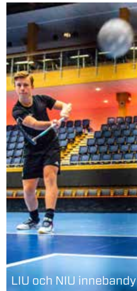
LIU och NIU innebandy

- Celsiusskolan och elitidrottsprogrammet gav mig en ordentlig skjuts i min proffskarriär. Möjligheterna att kombinera studier och basket passade mig perfekt.